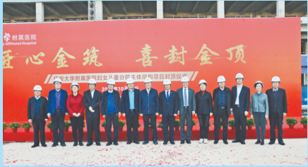
● 妇女儿童医院门诊住院综合楼主体结构封顶