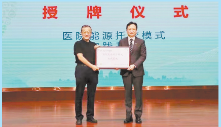
● 中国建筑节能协会绿色医院专业委员会授予延大附院“医院能源托管模式实践基地”称号