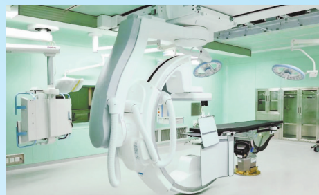
● 陕北首间数字一体化复合手术室正式投用

化项目、门诊大厅布局优化、运营管理项目认领模式、“运营思维同步行头脑风暴”等具体项目，经过两年多的艰辛努力，运营管理初见成效，为今后的运营管理工作奠定了基础、提供了经验。