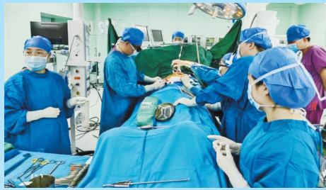
● 陕北区域首例应用一体机全程指导实施心脏介入手术