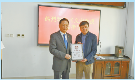
● 张文宏教授(右)受聘为延大附院客座教授

回眸过去的一年，延安大学附属医院全体干部职工不忘初心、牢记使命，执着坚守、护佑生命，交出了一份份满意的答卷。回首不平凡的2023年，附院人奋勇前