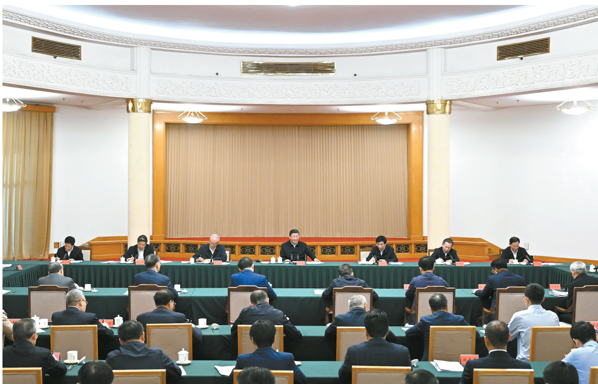
5月23日下午,中共中央总书记、国家主席、中央军委主席习近平在山东省济南市主持召开企业和专家座谈会并发表重要讲话。

习近平指出,改革是发展的动力。进一步全面深化改革,要锚定完善和发展中国特色社会主义制度、推进国家治理体系和治理能力现代化这个总目标,紧扣推进中