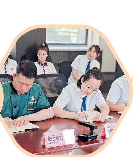
▲ 相关负责人认真听取学生想法