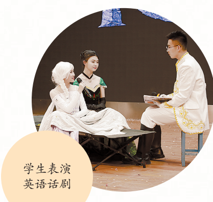
学生表演英语话剧