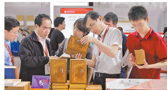
● 6月19日，读者在第三十届北京图博会“中国作家馆”翻阅图书。

新华社北京6月19日电 6月19日，第三十届北京国际图书博览会在北京国家会议中心开幕，中央政治局委员、中宣部部长李书磊参观调研图博会。