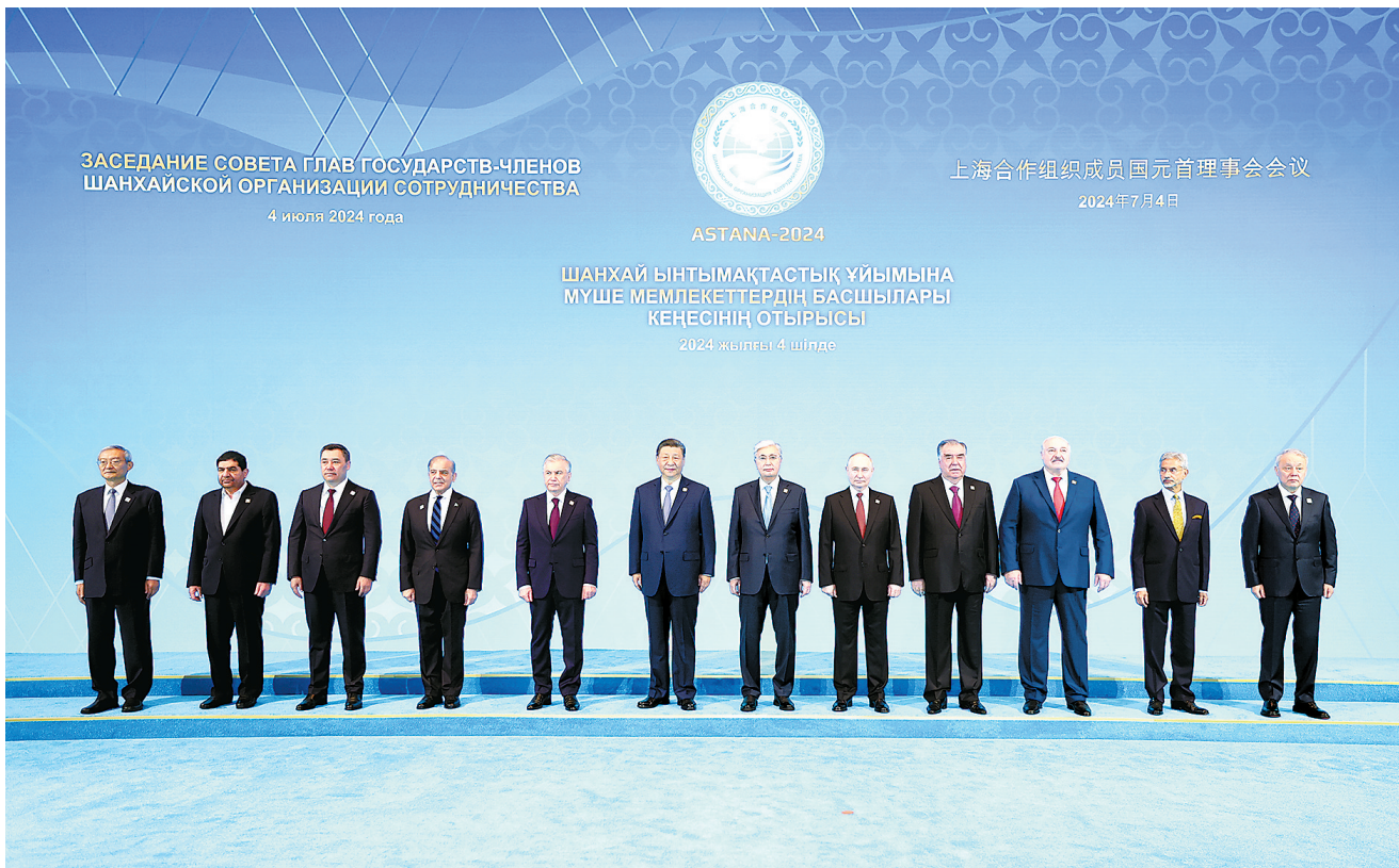
● 当地时间7月4日上午,国家主席习近平在阿斯塔纳独立宫出席上海合作组织成员国元首理事会第二十四次会议。