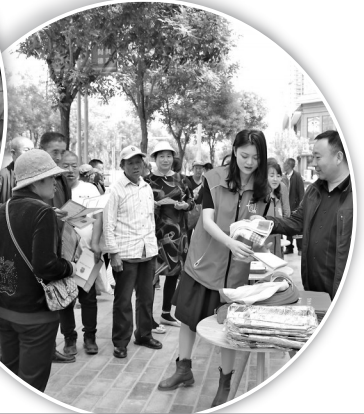
文明条例学习宣传活动