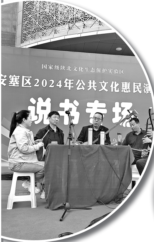
公共文化惠民演出

在安塞区，像这样的新时代文明实践站每天都在以不同的方式上演。如今，农民茶余饭后谈论张家李家长短的少了，关心国家大事的多了；不孝敬老人、赌博的人少了，一心奔小康的人多了，新时代文明实践，已经成为安塞区教育群众、引导群众的助推器，也融入到了每个安塞人的日常生活中。