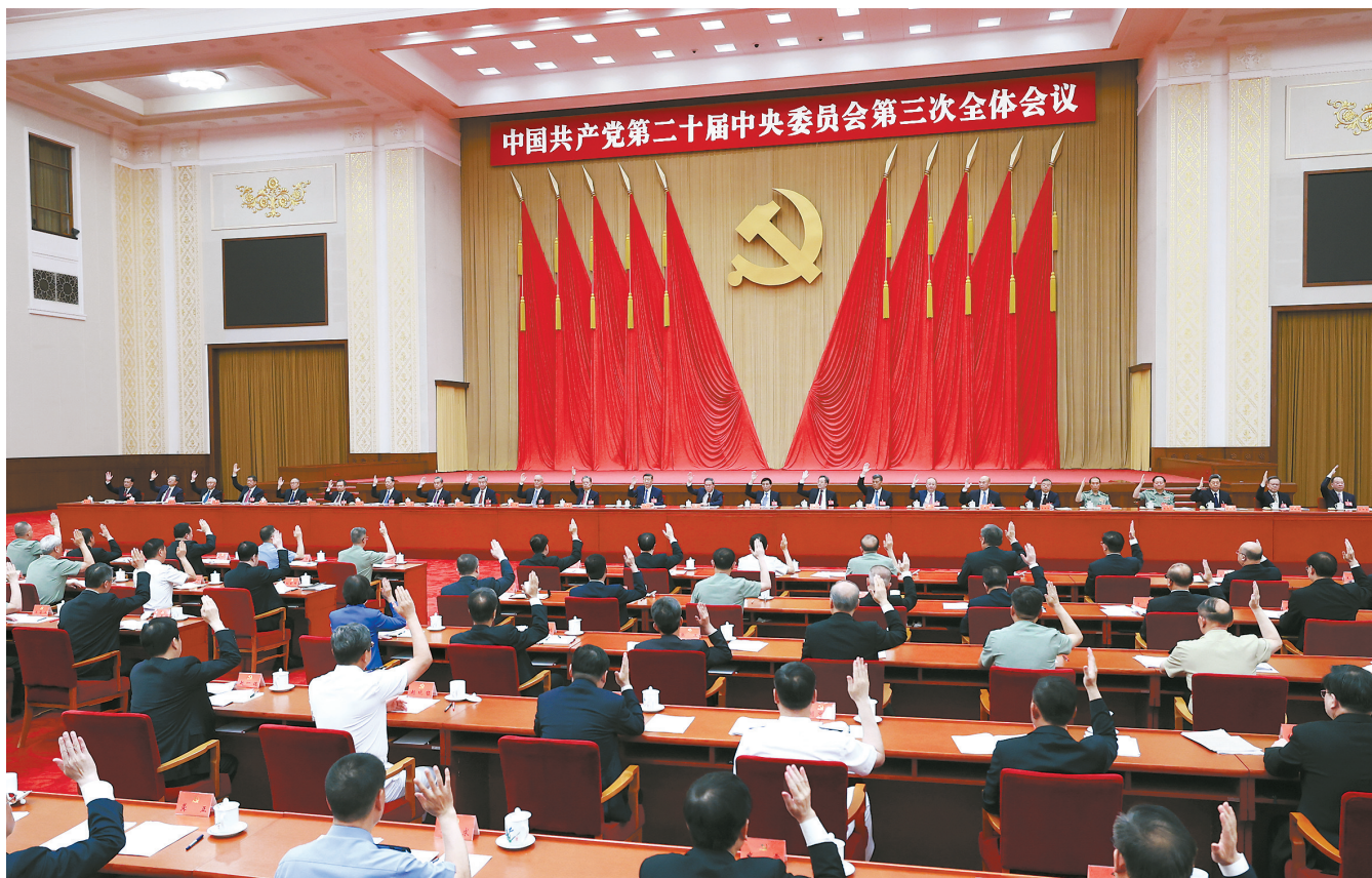
● 中国共产党第二十届中央委员会第三次全体会议,于2024年7月15日至18日在北京举行。中央委员会总书记习近平作重要讲话。