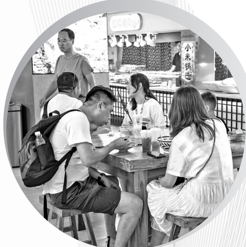
● 游客在壶口食集就餐

一句句点评温暖人心，一场场活动引人注目，一批批游客慕名前来。如今的宜川县正以开放的姿态迎接各地游客，用自己的实际行动，不断擦亮宜川旅游招牌。