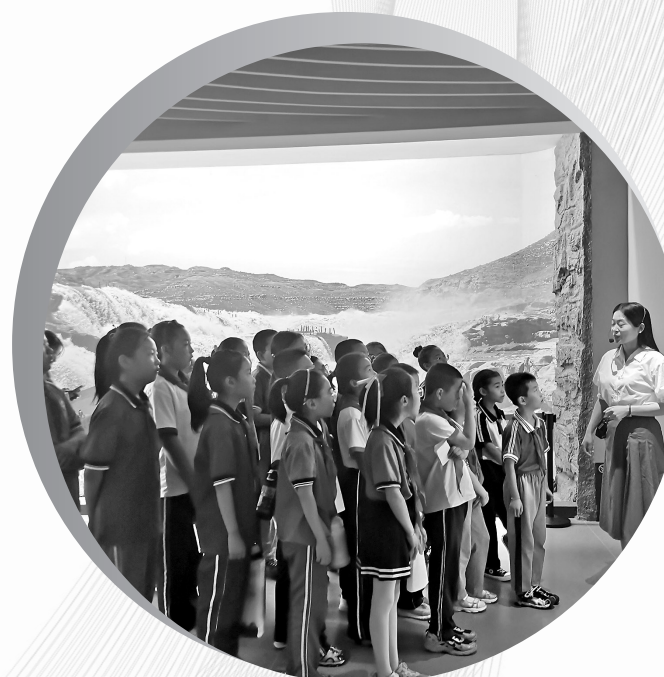
● 学生们到宜川县博物馆参观