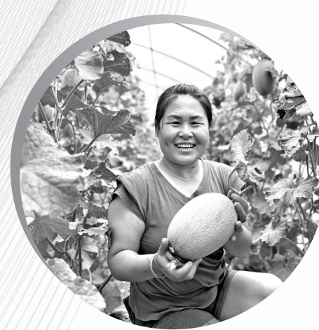
● 游客在乡村体验采摘乐趣