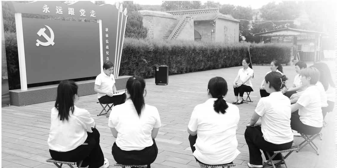
● 当地干部职工在秋林抗战纪念馆上党课