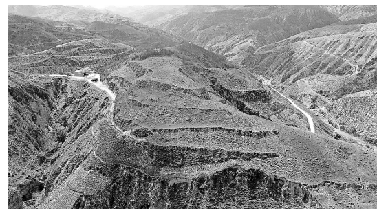
● 子长市李家岔镇胡家沟自然村疑似石城遗址全貌

本报讯(通讯员 张亚宁 记者 李欢)记者9月4日从子长市第四次全国文物普查队获悉,该文物普查队在子长市大理河与其支流交汇的河口地带发现了一座疑似石城遗址。