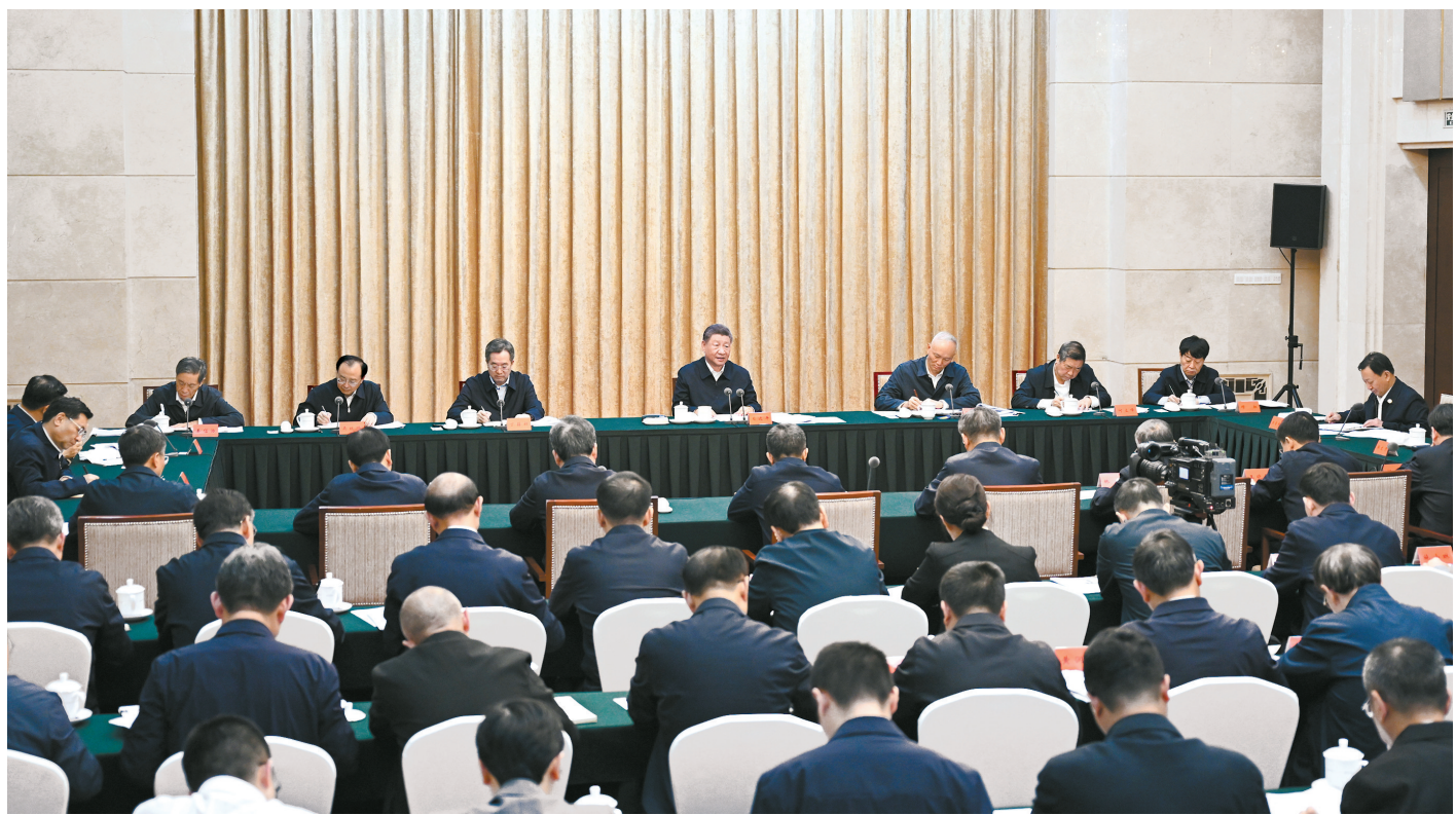
● 9月12日下午,中共中央总书记、国家主席、中央军委主席习近平在甘肃省兰州市主持召开全面推动黄河流域生态保护和高质量发展座谈会并发表重要讲话。