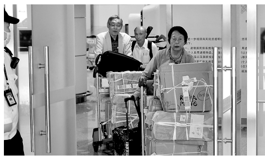
● 9月12日，日本民间口述历史访问讲演团一行10人乘机抵达长春。

新华社长春9月12日电(记者 张博宇 唐铭泽)12日下午，日本民间口述历史访问讲演团一行10人乘机抵达长春。访问团中多人是侵华日军后代，此次来华的主要目的，是代替犯下侵略罪行的父辈，向中国人民郑重谢罪。