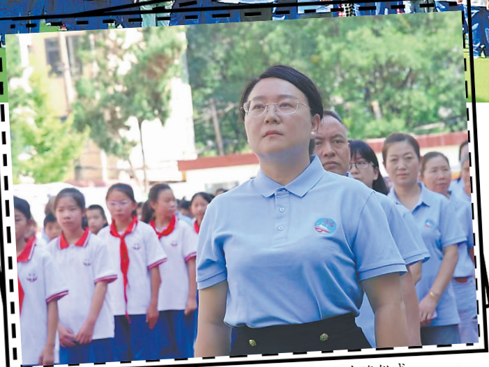
▲ 师生神情肃穆参加升旗仪式