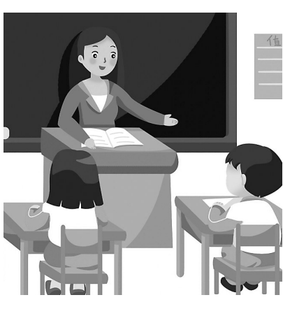
中华文化是放眼全世界最为耀眼的一颗星星，而这颗星星闪耀了千年，却不

不暗分毫，仍吸收来自四面八方的信仰之光，向前迈进一步又一步坚定的步伐。在这一个又一个的脚印里，我们看到的是无数传承者奋力托举的汗水。这一个个充满星光的身影，共同拥有着平凡而响亮的名字——老师。他们是伟大的传承者，愿把一身经纶授予学生，从不为自己的利益，只求满树的桃李，开满枝头，散发出醉人的芳香。是的，老师是我们人生永恒的最初光芒。我们行走在人生的宽阔大道上。一个人从稚嫩的幼儿成长为热血的青年，再逐步步入成熟。一路上充满了诱惑，如杂乱的枯枝丫从身心长出，去吸收本该滋生希望的养分，他拉着我们向堕落的深渊滑去。如在这黑暗的路上，无人来修剪枝丫，输送养分，那便