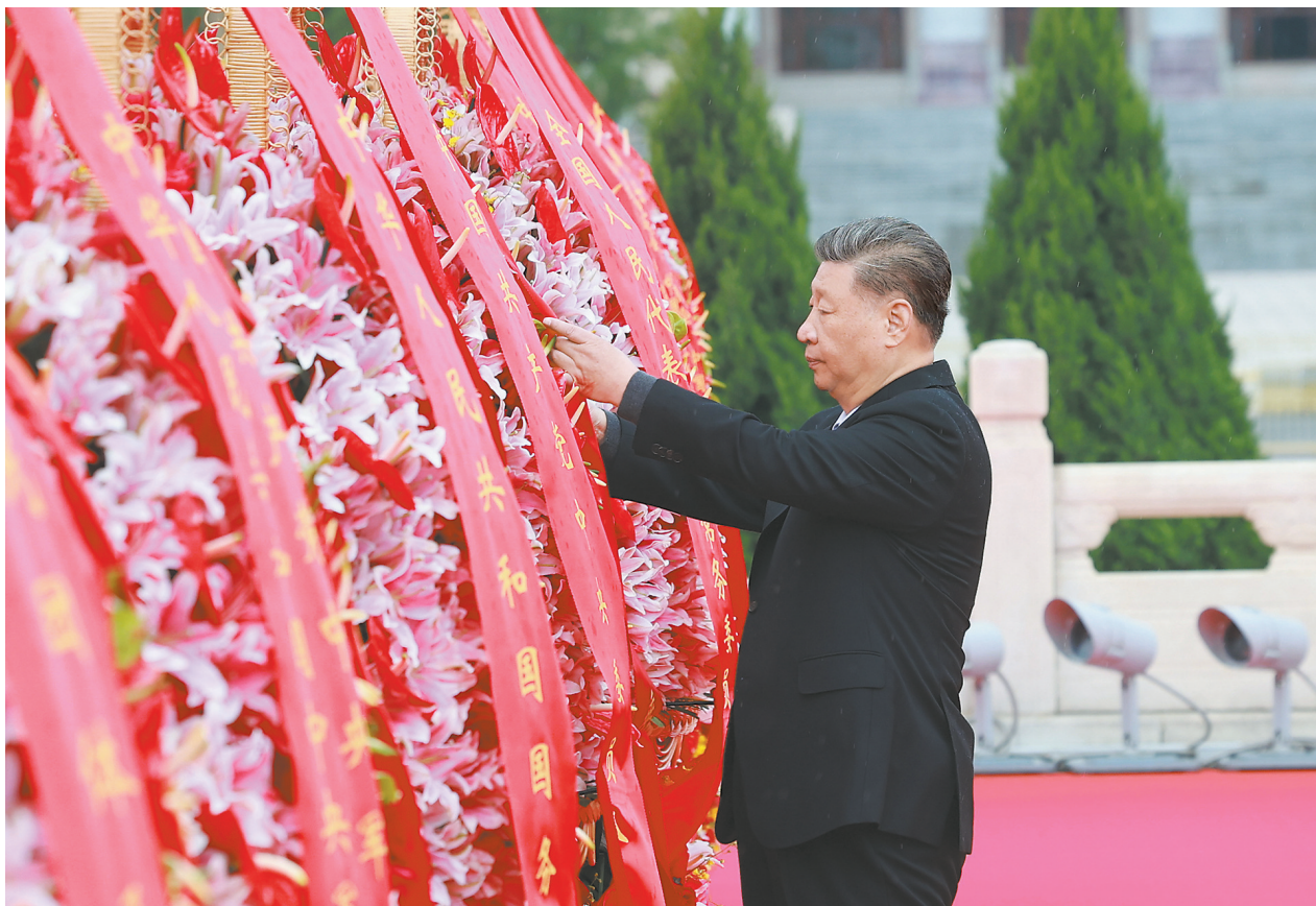
9月30日上午，党和国家领导人习近平、李强、赵乐际、王沪宁、蔡奇、丁薛祥、李希、韩正等来到北京天安门广场，出席烈士纪念日向人民英雄敬献花篮仪式。这是习近平整理花篮上的缎带。

新华社北京9月30日电 在庆祝中华人民共和国成立75周年之际，烈士纪念日向人民英雄敬献花篮仪式30日上午在北京天安门广场隆重举行。党和国家领导人习近平、李强、赵乐际、王沪宁、蔡奇、丁薛祥、李希、韩正等，同各界代表一起出席仪式。