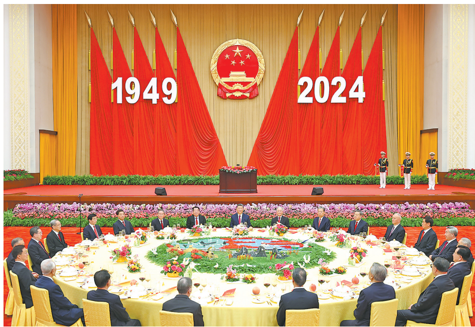
九月三十日晚，庆祝中华人民共和国成立七十五周年招待会在北京人民大会堂隆重举行。习近平、李强、赵乐际、王沪宁、蔡奇、丁薛祥、李希、韩正等党和国家领导人出席招待会并发表重要讲话。

新华社北京9月30日电 庆祝中华人民共和国成立75周年招待会30日晚在人民大会堂隆重举行。中共中央总书记、国家主席、中央军委主席习近平出席招待会并发表重要讲话。他强调，中华人民共和国成立75年来，我们党团结带领全国各族人民不懈奋斗，创造了经济快速发展和社会长期稳定两大奇迹，中国发生沧海桑田的巨大变化，中华民族伟大复兴进入了不可逆转的历史进程。新时代新征程，中国人民必将创造出新的更大辉煌，必将为人类和平发展的崇高事业作出新的更大贡献。