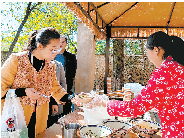
● 体验团成员在甘泉豆腐小镇品尝甘泉豆腐制作的美食

非物质文化遗产是中华优秀传统文化的重要组成部分,是我国各族人民宝贵的精神财富。秋日的陕北,天空湛蓝、层林尽染,如诗如画的美景中,徜徉于延安的非遗文化,让旅游的体验分外美好。10月22日,“追寻红色足迹 共享非遗大集”2024年西北地区非遗宣传展示活动在延安启动。随后,作为本次活动的系列活动之一,“我要去延安”——延安非遗+旅游体验活动于23日展开。来自西北地区的特邀嘉宾、文旅部门人员及非遗传承人等70余人组成的体验团,按照延川和宜川两条旅游线路出发,行走在延安大地上欣赏自然风光,感受红色文化,体味非遗魅力。位于延川县的乾坤湾,是集峡谷奇观、人文景观、民俗民风、红色文化为一体的国家5A级旅游景区,也是著名的黄河蛇曲国家地质公园和国家水利风景区。景区内主要有乾坤湾、清水关、定情岛、红军东征革命纪念馆等景点。站在黄河西岸,看着黄河在这里完美地回弯了320度,让大家不