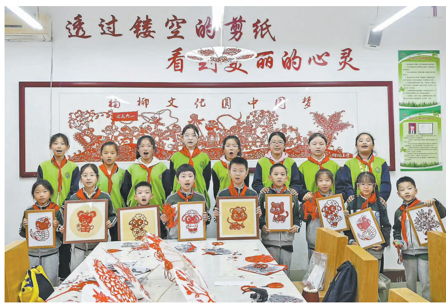
● 柳林小学学生向中科大附中独墅湖学校同学赠送剪纸作品