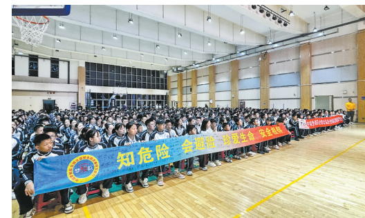
● 学生认真聆听演讲