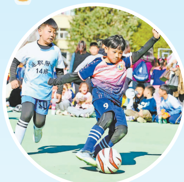
● 足球场上奋力拼抢