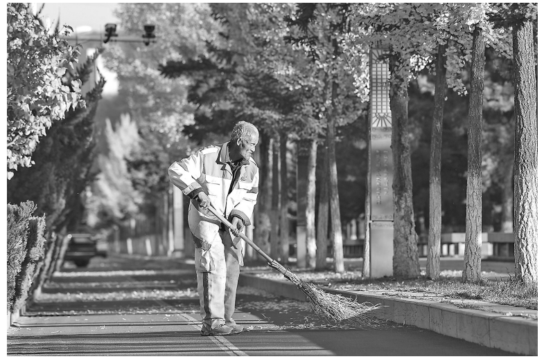
● 环卫工人正在清扫街道