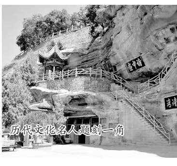
历代文化名人题刻一角