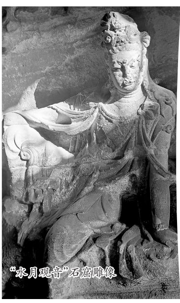
“水月观音”石窟雕像