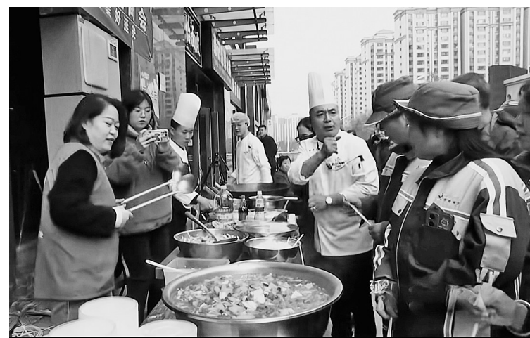
● 环卫工人和老人们领取爱心午餐

本报讯（记者 李欢 方飞飞）近日，在延安新区杨家岭南苑社区“荣记海鲜”门口，只见一位环卫工人和老人们聚集在这里排队领取午餐，旁边刚刚出锅的烩菜和馒头正冒着热气。