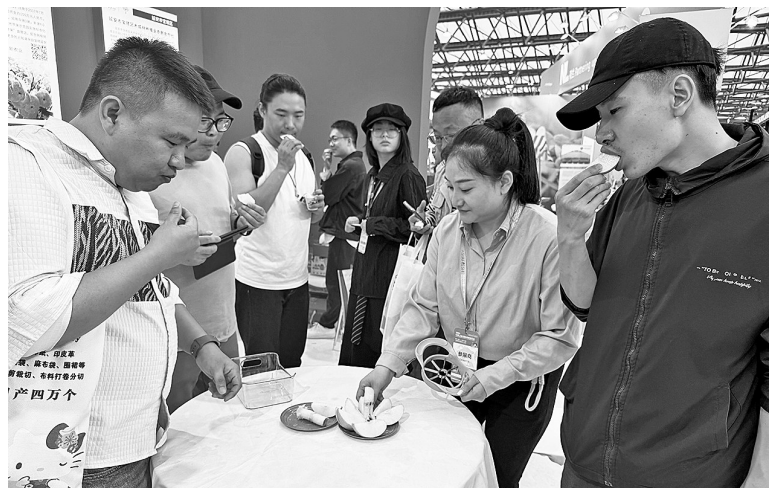
● 上海市民争相品尝黄陵翡翠梨

黄陵翡翠梨被誉为“中国第一梨”，其皮如翡翠、肉如羊脂、细腻无渣、口感脆甜，2017年10月荣获国