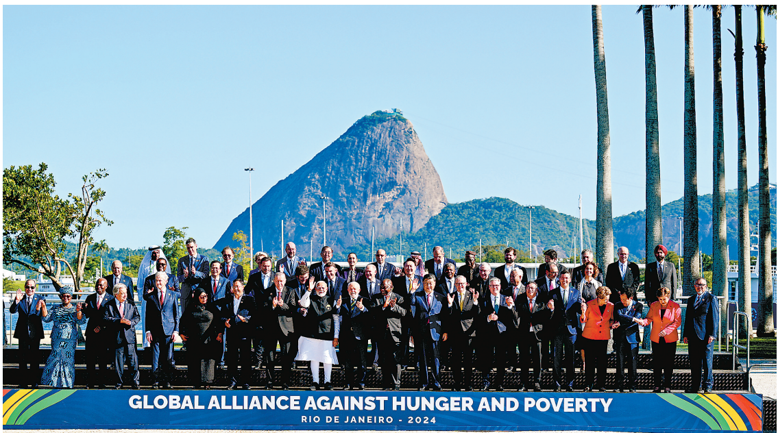
GLOBAL ALLIANCE AGAINST HUNGER AND POVERTY RIO DE JANEIRO - 2024

当地时间11月18日上午，国家主席习近平在巴西里约热内卢出席二十国集团领导人第十九次峰会。峰会把“构建公正的世界和可持续发展的星球”作为主题，并决定成立“抗击饥饿与贫困全球联盟”。这是习近平同与会领导人共同参加巴方发起的“抗击饥饿与贫困全球联盟”合影。