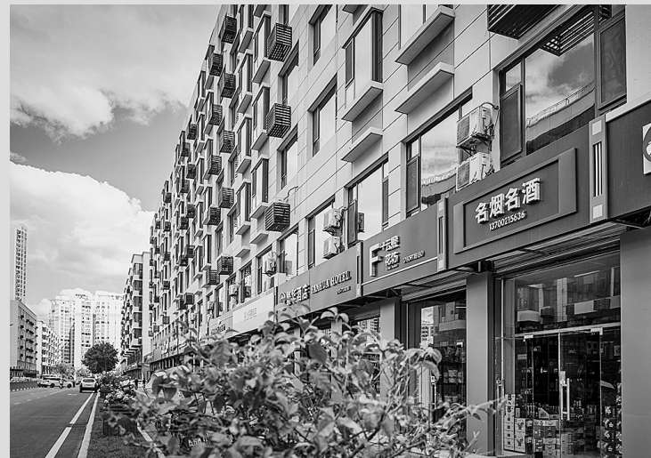
● 改造后的门头牌匾