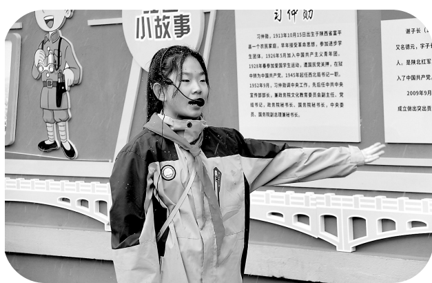
北关小学学生为观摩老师介绍校园