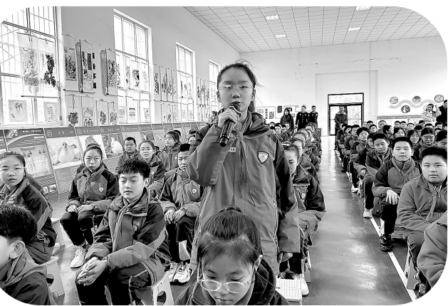
同学们和民警进行交流

校园应该是学生学习和成长的乐园,而不是一个充满恐惧和伤害的地方,为构建平安和谐的校园,预防校园欺凌事件的发生,增强学生的法治意识,提高学生的自我保护能力,11月20日,宝塔知新小学开展了以“预防校园欺凌 无毒伴我成长”为主题的教育活动。