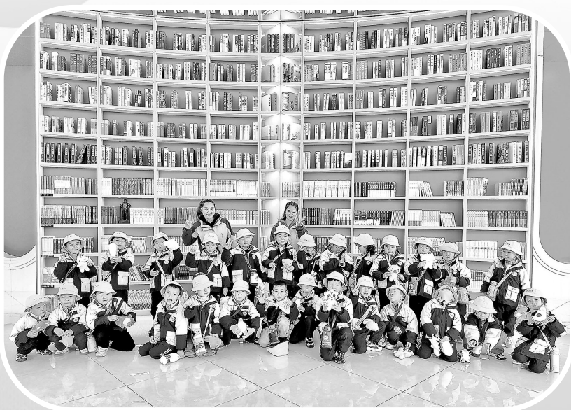
小朋友们参观阅览中心