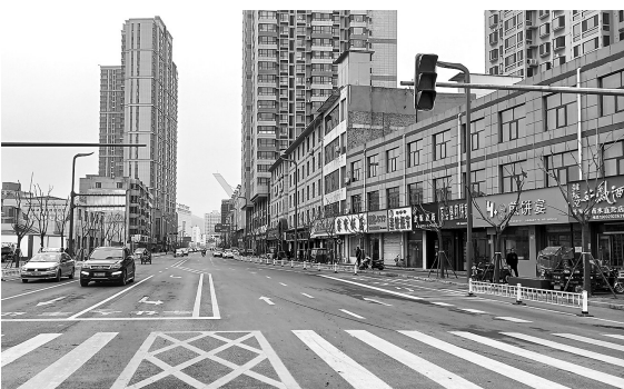
● 改造后的秀延街道