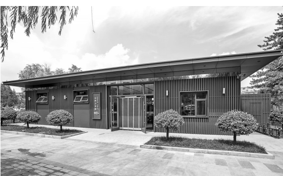
● 提升改造后的公共卫生间