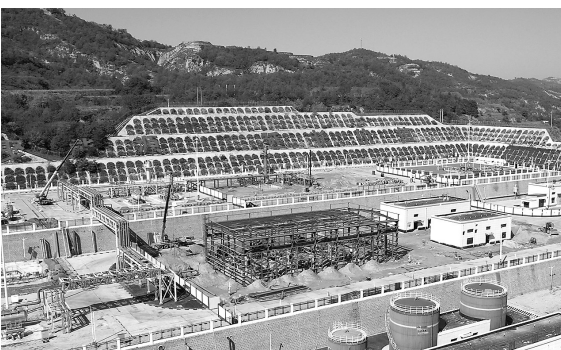
● 延长石油采气五厂施工现场