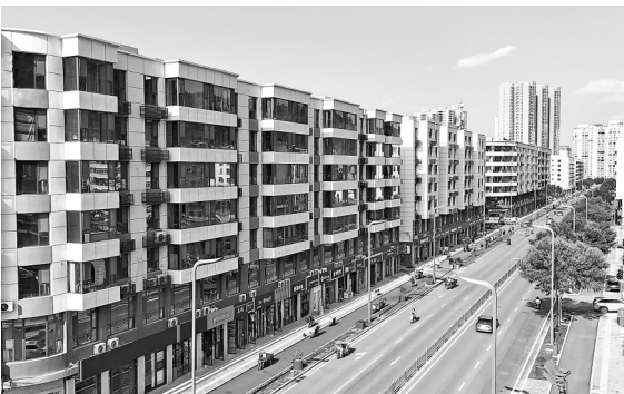
● 楼房外立面焕然一新