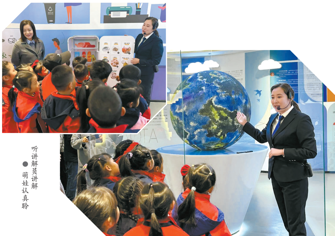
听讲解员讲解 萌娃认真聆听