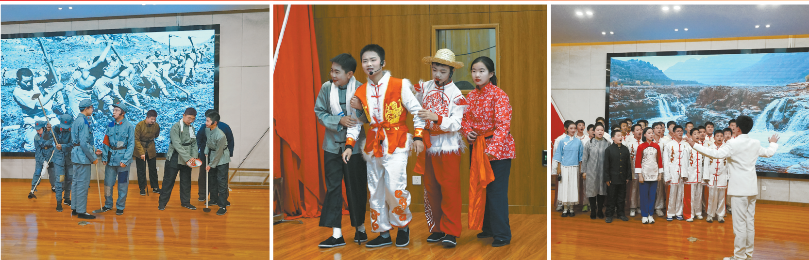
情景剧展演精彩瞬间

近日，延安职业技术学院附属中学举行了以“追寻红色足迹 传承延安精神”为主题的政史地学科特色活动暨校园情景剧展演。