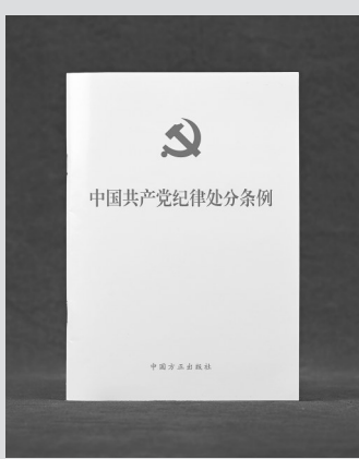
● 这是《中国共产党纪律处分条例》。

2024年4月起，党纪学习教育在全党深入开展。以党纪为主题在全党开展集中性教育，在我们党的历史上是首次。各地区各部门深入学习贯彻习近平总书记关于全面加强党的纪律建设的重要论述，原原本本、逐章逐条学习新修订的《中国共产党纪律处分条例》，抓好以案促学、以训助学，教育引导党员干部学纪、知纪、明纪、守纪，以严明的纪律确保全党自觉同以习近平同志为核心的党中央保持高度一致，统一思想、统一行动，知行知止、令行禁止，形成推进中国式现代化的强大动力和合力。