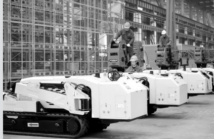
● 2024年12月12日，在位于浙江省湖州市德清县德清精益智能工厂，工人赶制履带式轻型组塔装置产品。

针对台湾地区领导人赖清德顽固坚持“台独”立场、大肆宣扬分裂谬论，妄图“倚外谋独”“以武谋独”，大陆方面严正表示，对于任何形式的“台独”分裂行径，决不容忍、决不姑息。2024年5月23日至24日，中国人民解放军东部战区组织战区陆军、海军、空军、火箭军等兵力，位台湾周边开展“联合利剑—2024A”演习；2024年10月14日，中国人民解放军东部战区组织战区陆军、海军、空军、火箭军等兵力，位台湾海峡、台岛北部、台岛南部、台岛以东开展“联合利剑—2024B”演习。这是对台湾地区领导人谋“独”挑衅的坚决惩戒，是对“台独”分裂势力谋“独”行径的强力震慑，是对外部势力纵容支持“台独”、干涉中国内政的严厉警告，是捍卫国家主权和领土完整的正义之举。