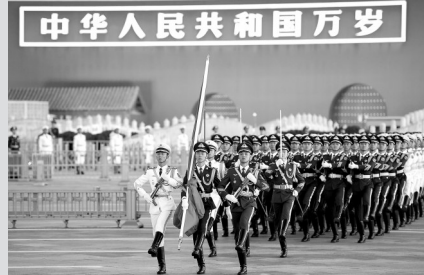
● 2024年10月1日清晨，隆重的升国旗仪式在北京天安门广场举行，庆祝中华人民共和国成立75周年。