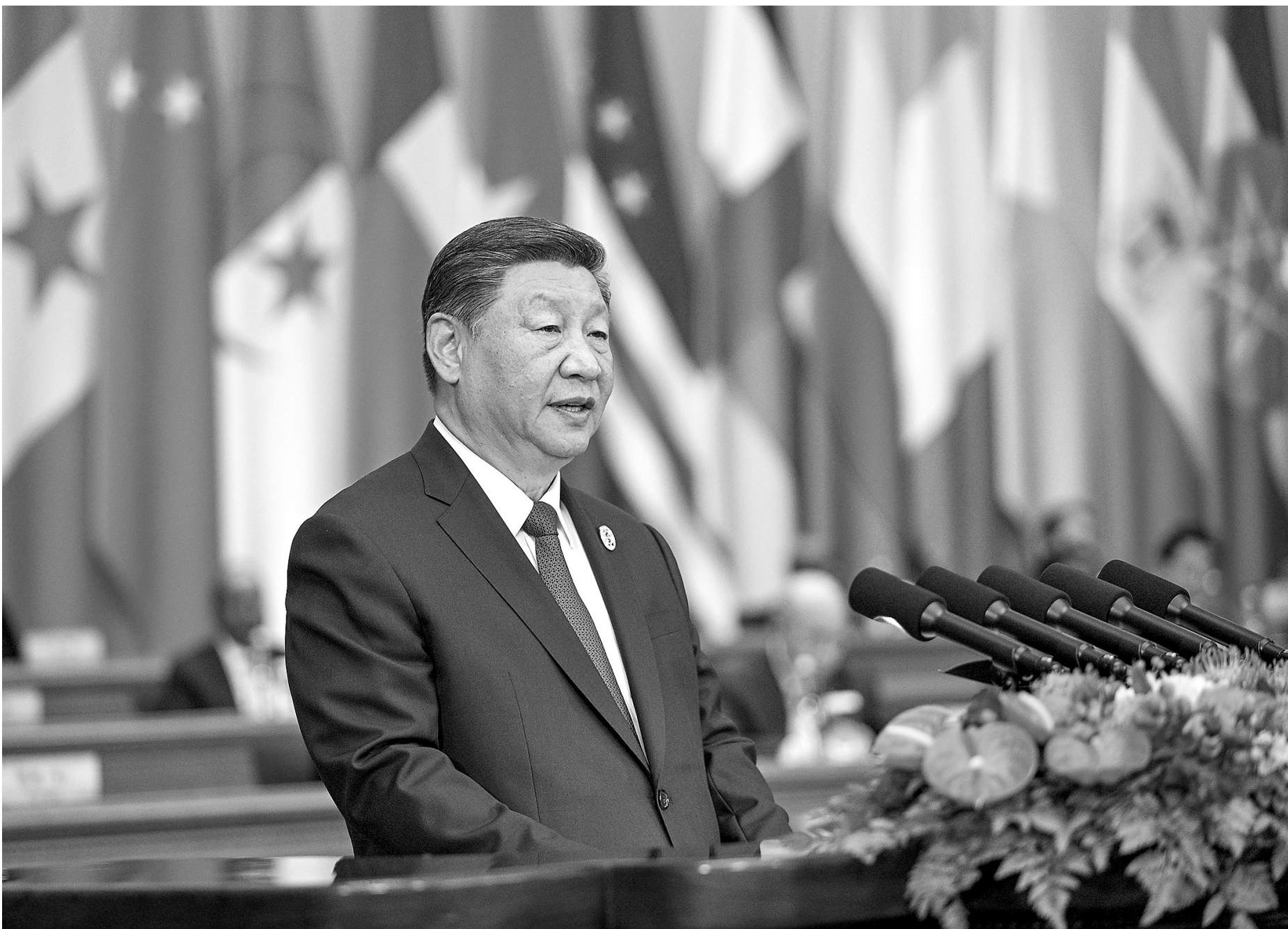
● 2024年9月5日上午，国家主席习近平在北京人民大会堂出席中非合作论坛北京峰会开幕式并发表题为《携手推进现代化，共筑命运共同体》的主旨讲话。