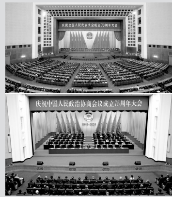
● 上图：2024年9月14日，庆祝全国人民代表大会成立70周年大会。 下图：2024年9月20日，庆祝中国人民政治协商会议成立75周年大会。