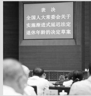
● 2024年9月13日上午，十四届全国人大常委会第十一次会议在北京人民大会堂闭幕。会议表决通过了全国人大常委会关于实施渐进式延迟法定退休年龄的决定。