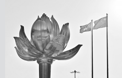
● 2024年12月20日，澳门特别行政区政府隆重举行升旗仪式，庆祝澳门回归祖国25周年。