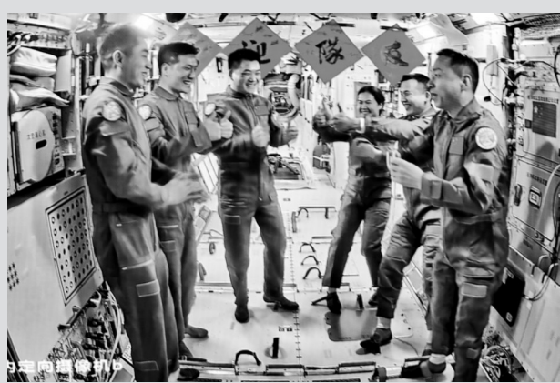
● 2024年10月30日在北京航天飞行控制中心拍摄的神舟十九号航天员乘组和神舟十八号航天员乘组交流的画面。