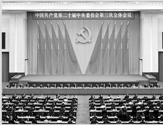
● 中国共产党第二十届中央委员会第三次全体会议，于2024年7月15日至18日在北京举行。会议审议通过《中共中央关于进一步全面深化改革、推进中国式现代化的决定》。锚定2035年基本实现社会主义现代化的目标。

2024年4月和10月，神舟十八号、十九号载人飞船相继出征太空；2024年12月，神舟十九号乘组刷新中国航天员单次出舱活动时长纪录。2024年6月25日，历时53天的嫦娥六号任务在人类历史上首次实现月球背面采样返回。2024年11月1日，中国第41次南极考察队破浪出征，开展对2024年2月7日落成的中国第五座南极考察站秦岭站的配套设施建设，进行科研和后勤保障领域的国际合作。截至2024年11月26日，“中国天眼”FAST发现脉冲星数量已突破1000颗，超过同一时期国际其他望远镜发现脉冲星数量的总和。我国战略高技术领域迭创佳绩，重大科技工程捷报频传，见证我国加快建设科技强国，科技创新能力快速提升。