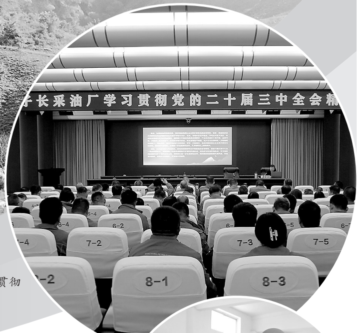
子长采油厂学习贯彻党的二十届三中全会精神