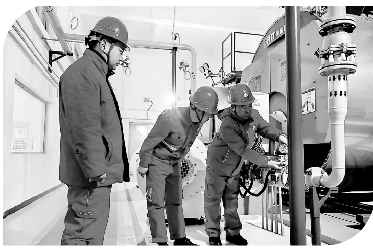
管理人员检查锅炉设备

全面开展“决战四季度、助力稳增长”安全生产劳动竞赛活动,百里油区掀起了一场全力以赴抓生产、凝心聚力抓进度的夺油大干热潮,厂党政及时组织劳动竞赛慰问和形势任务宣讲,激发基层员工奋战四季度的昂扬斗志和冲天干劲。