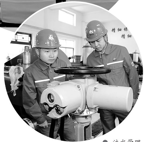
注水管理 办公室人员检查注水设备运行情况