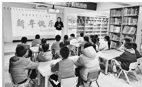
▲小朋友听讲剪纸知识 ▲工作人员给