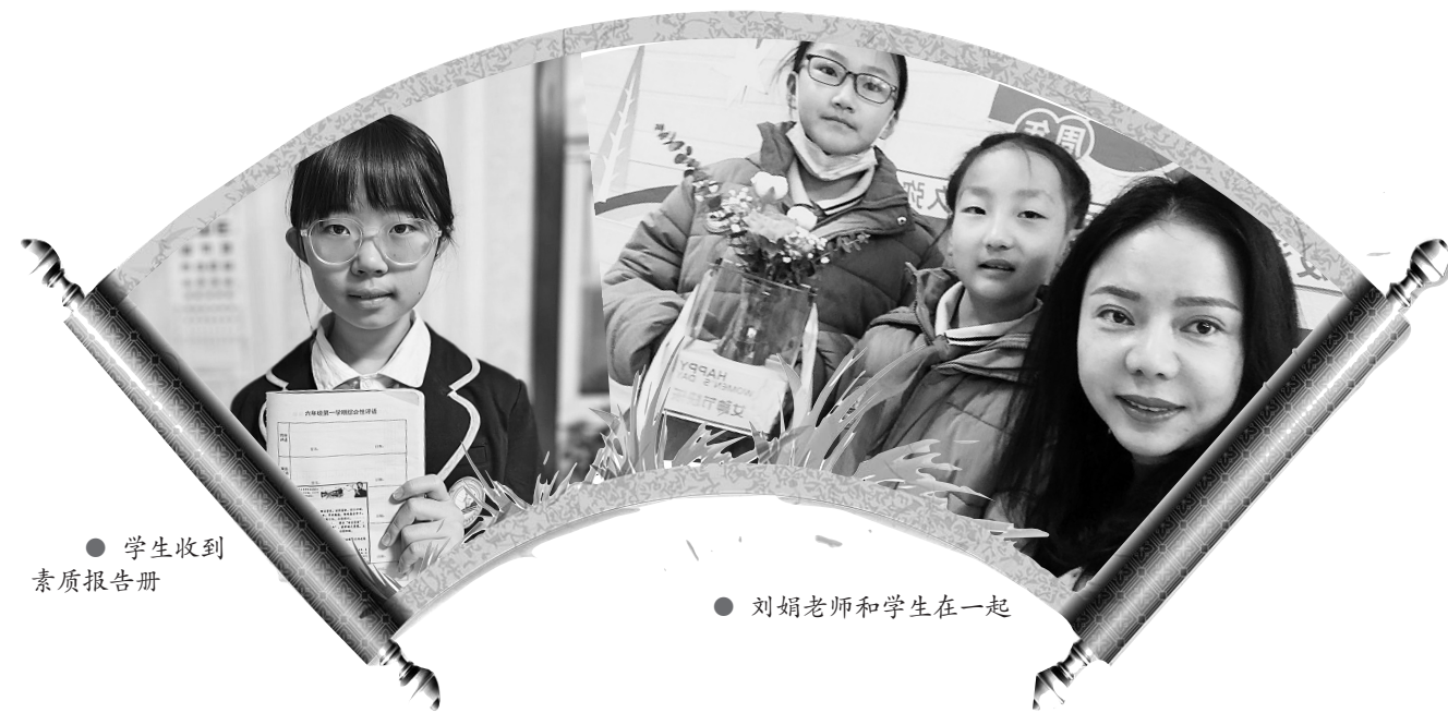
● 学生收到素质报告册