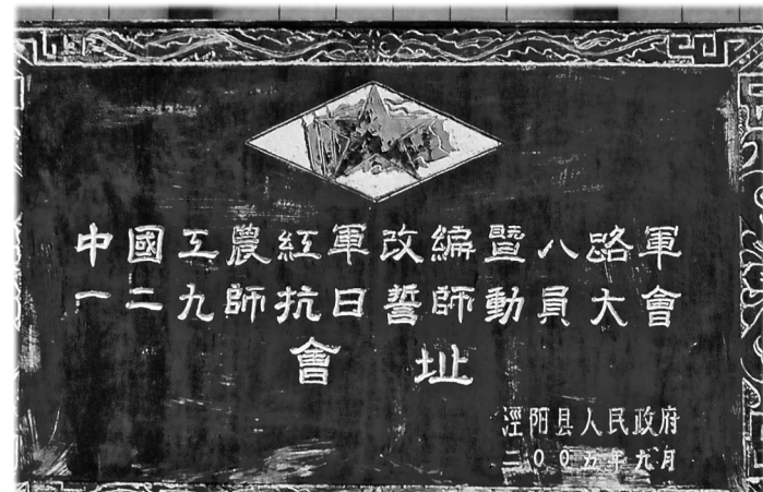
中国工农红军改编暨八路军129师抗日誓师动员大会会址。

“八路军战士们出征时，群众奔走相告，敲锣打鼓、鸣放鞭炮，杀猪宰羊、箪食壶浆。”泾阳县红色文化研究会总顾问焦志学说：“听我母亲讲，那时云阳家家户户都住过八路军。”