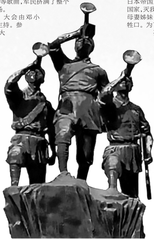
《救亡号角》抗日纪念雕塑。