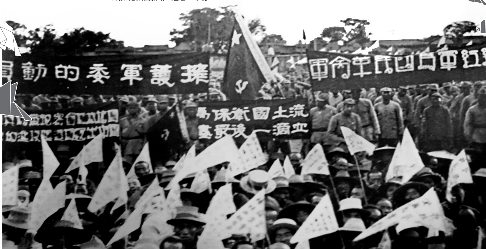
八路军总部和第一一五师在云阳镇大操场召开抗日誓师大会。