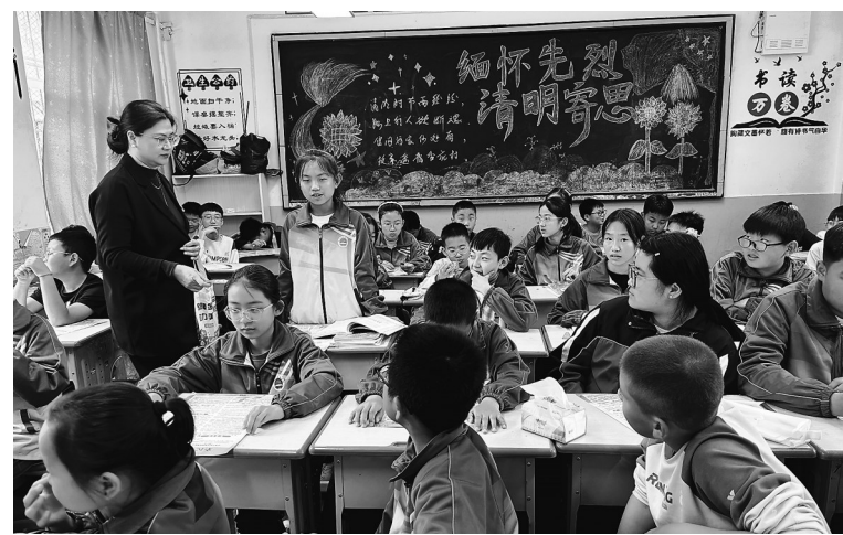
● 延川县图书馆工作人员走进校园,开展阅读推广活动

本报讯(记者 李欢 通讯员 刘娟)春风拂面,书香四溢。在全民阅读活动周期间,延川县图书馆积极行动,走进广场、机关、企业、学校等地,开展了一系列丰富多彩的阅读推广活动,让书香浸润延川,推动全民阅读走深走实。4月23日,延川县图书馆走进文化广场,举办“以法促读 以读润心”世界读书日暨《全民阅读促进条例》宣传活动。活动现场人头攒动,书香氤氲,工作人员向过往群众发放《全民阅读促进条例》《公共图书馆法》等宣传资料,并向群众发出倡议,号召大家热爱学习、勤于读书,从书籍中汲取文化财富与精神食粮,让阅读成为生活常态。