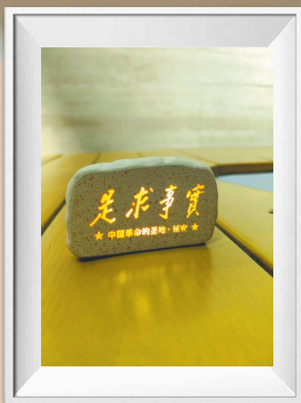
小夜灯香薰冰箱贴