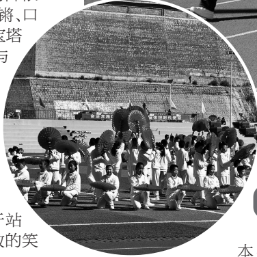
◀ 文体展演