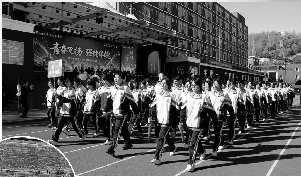
▲ 方阵入场