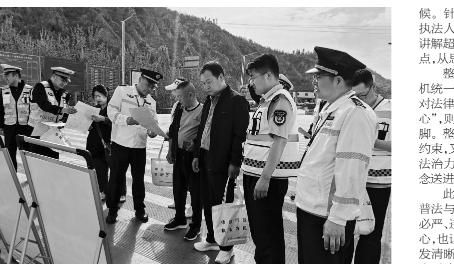
● 工作人员向群众发放宣传资料

本报讯(通讯员 王宝明)5月13日上午,省路政执法总队第六支队十二大队紧扣“公路执法守底线,路政服务暖民心”主题,联合志丹高交执勤大队、志丹路养中心、安塞西路养中心、志丹收费站等多部门,在志丹服务区及收费站广场集中开展了形式多样、内容丰富的“路政宣传月”活动,以联动之力传递法治温度,以务实之举守护一路平安。 在收费站广场,多部门工作人员协同搭建起生动的宣传阵地。图文并茂的展板依次排开,吸引过往群众驻足观看;宣传人员热情发放宣传资料,用通俗易懂的语言提供现场咨询,深入讲解《公路法》《公路安全保护条例》《超限运输车辆行驶公路管理规定》等法律法规,并围绕高速公路安全、违法超限运输的严重危害等内容以案释法、答疑解惑,在面对面交流中不断强化群众爱路护路的责任意识。 在志丹服务区内,联合宣传队伍