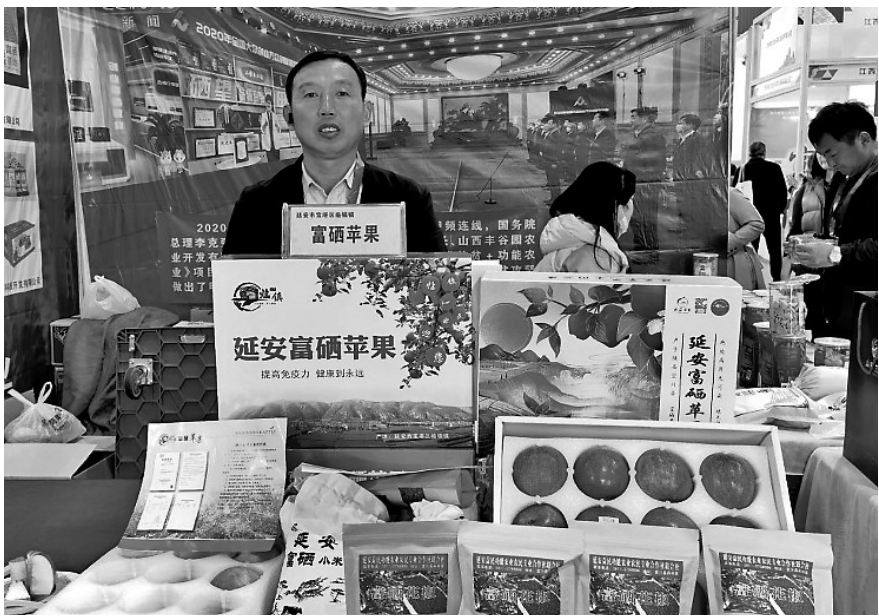
● 2024年山东济南第六届全国富硒农产品展销会上展示延安富硒产品