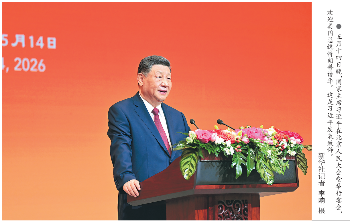
● 五月十四日晚，国家主席习近平在北京人民大会堂举行宴会，欢迎美国总统特朗普访华。这是习近平发表致辞。