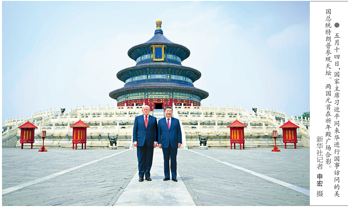
● 五月十四日，国家主席习近平同来华进行国事访问的美国总统特朗普参观天坛。两国元首在祈年殿广场合影。