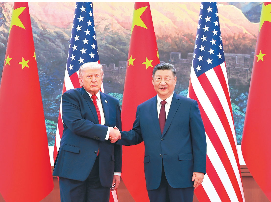
● 5月14日上午，国家主席习近平在北京人民大会堂同来华进行国事访问的美国总统特朗普举行会谈。