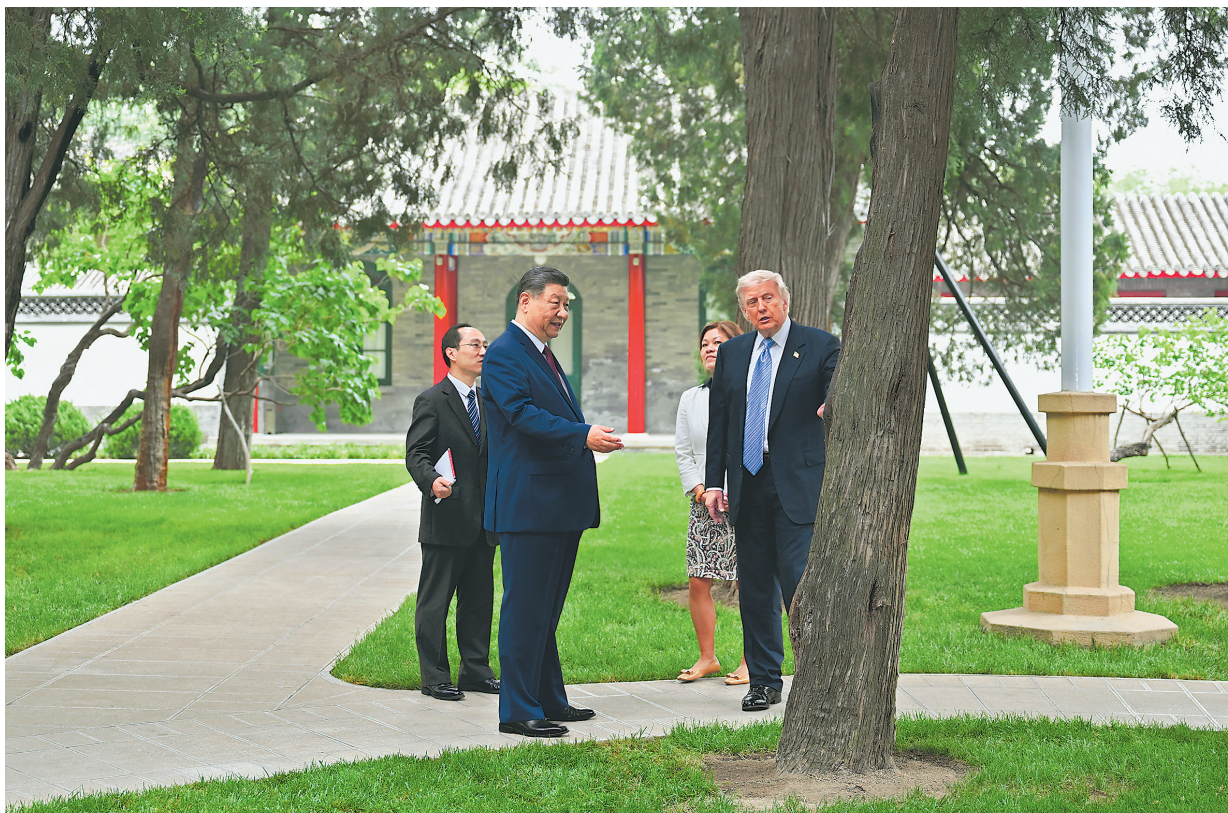
● 5月15日上午，国家主席习近平在中南海同美国总统特朗普举行小范围会晤。这是特朗普抵达时，习近平热情迎接。