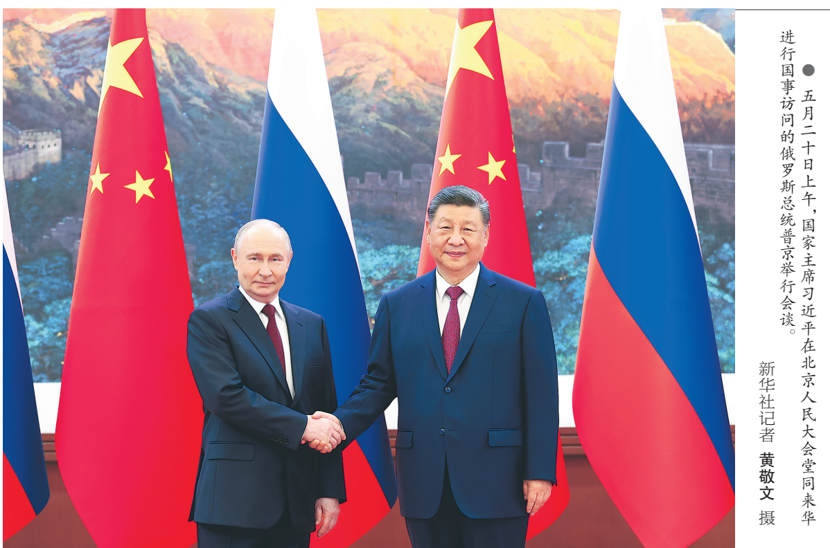
●五月二十日上午，国家主席习近平在北京人民大会堂同俄罗斯总统普京举行会谈。