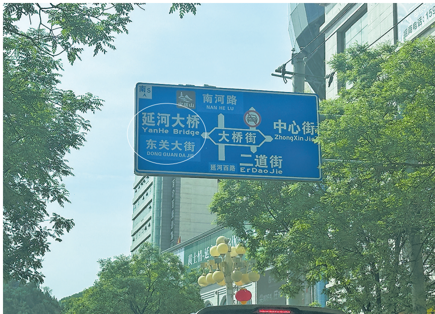
● 路牌上汉语拼音与英文混用

在走访中，记者发现宝塔山的英译混乱尤为突出。南河路边的蓝色指路牌标注“Baota Mountain”，不远处另一块旅游牌却写作“Pagoda Mountain”，而景区山脚下的路牌使用“Mount Baotashan Scenic Area”。记者查阅相关标准及《公共场所公示语英文译写规范》地方标准，“Baota Mountain”遵循“专名音译、通名意译”原则，是官方普遍使用的规范译法。此外，陕甘宁边区政府旧址的英文