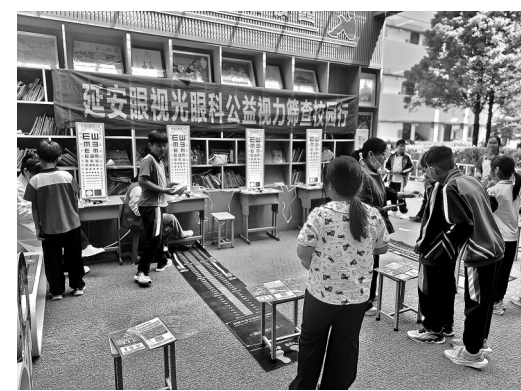
中小學生視力健康監測篩查現場

本报讯（通讯员 陆朋飞）2026年春季学期，延安市宝塔区全面启动辖区中小學生視力健康監測篩查工作。本次行動由宝塔區教育體育局統籌安排，延安眼視光眼科提供專業技術支撐與現場篩查服務，穩步推進全區青少年近視防控各項措施落實。