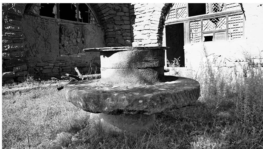
● 老石磨藏着旧时光