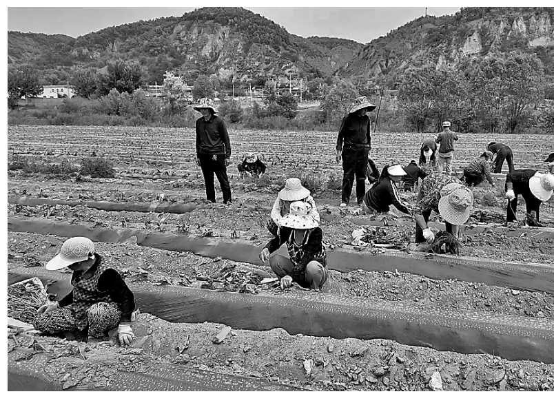
● 村民栽植红薯苗

不仅如此，基地还依托赵家河粉条加工厂，将品相稍逊的红薯进行深加工，制成红薯粉条，形成“种