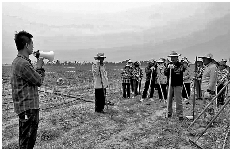
● 技术员正在向工人们讲解作业中的关键技术要点

“近期我们的核心工作主要围绕三点：杂草防控、水肥管理和植保防护，就是要确保七、八月份嫁接