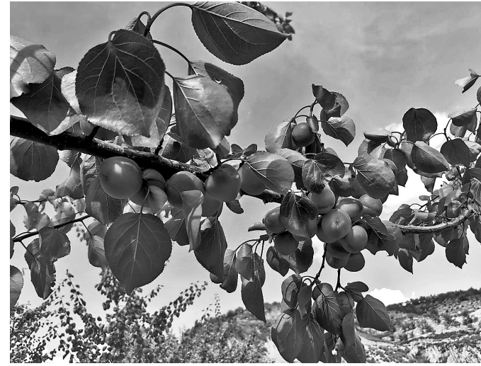
● 杏果挂满枝头

本报讯（通讯员 霍洁洁）初夏时节，来到子长市马家砭镇的山梁上，放眼望去，成片的红梅杏林层层叠叠，金红相间的杏果挂满枝头，在阳光下闪烁着诱人的光泽。采摘的村民穿梭林间，欢声笑语回荡在山间。