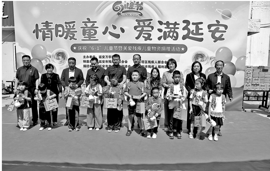
● 爱心人士向小朋友捐赠物品

捐赠仪式后,一场由医院儿童康复科师生、家长共同参与的文艺演出精彩上演。儿童康复科的女老师们用一支《天天向上》的舞蹈,展现了康