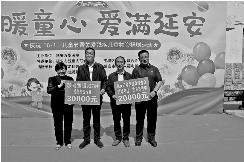
● 爱心单位向残疾儿童捐赠爱心物资和现金