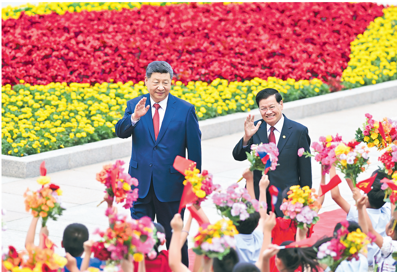
6月5日下午,中共中央总书记、国家主席习近平在北京人民大会堂同来华进行国事访问的老挝人民革命党中央总书记、国家主席通伦举行会谈。这是会谈前,习近平在人民大会堂东门外广场为通伦举行欢迎仪式。