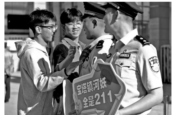
● 考生进考场前抚摸“985”警号

六月逐梦,不负韶华。6月7日清晨7时30分,在延安新区江苏中学考点门口,一个特殊的“啦啦队”格外引人注目——延安市公安局两位佩戴着“985”“211”警号的民警,站在校门口为即将奔赴考场的学子们加油鼓劲。