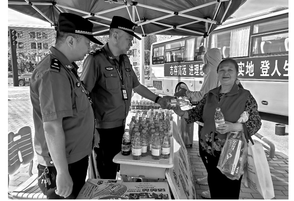
● 宝塔区城管局枣园中队便民服务点工作人员为陪考家长免费发放瓶装水

6月7日上午8点,满载考生的送考大巴车有序抵达延安市新区第二中学考点。来自延安育英中学的考生们,在陪考老师的引导下排队下车,整理证件、整队集合,从容有序地走向考场。延安育英中学高考带队组长容亚娟介绍说,为保障考生顺利应考,学校提前周密安排,在该考点调配4辆送考专车,安排9名教师全程陪考。他们从考生上下车秩序维护,到清点考生人数,逐一检查准考证、身份证等,每一个环节都细致严谨、一丝不苟。考生进入考场后,老师们坚守在考点外随时待命,第一时间响应考生突发需求,全方位保障学子安心应考。