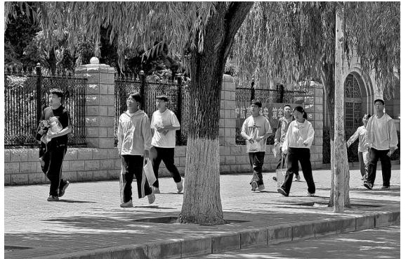
● 首场考试结束,考生们步履轻松走出考场

6月7日上午8时,延安市实验中学考点外人流涌动,考生们秩序井然步入考场,陪考家长驻足凝望,满眼皆是期盼,处处涌动温情。考点一侧,一支由延安市新区培文学校教师组成的送考队伍引人注目。“早上6点,我们全体教师准时集合,张贴送考横幅、清点备考物资、组织学生排队乘车,逐一检查准考证与考试用具。针对考生无法带入考场的银饰等物品,我们统一收纳保管,全力保障孩子们安心赴考、顺利入场。”现场送考老师介绍道。