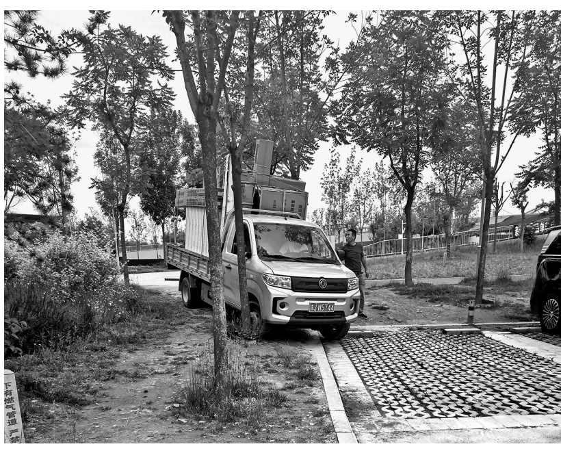
一辆送货车碾过绿化带