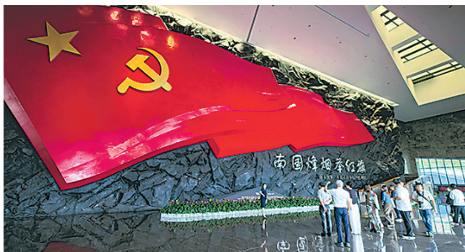
● 参观学习南方红军三年游击战争历史陈列展

本次采风活动为期5天，覆盖赣州、瑞金、于都、大余等核心红色片区，采用实地教学、情景教学、现场采访相结合的立体化学习模式，实现行走悟史、研学促思、交流赋能。