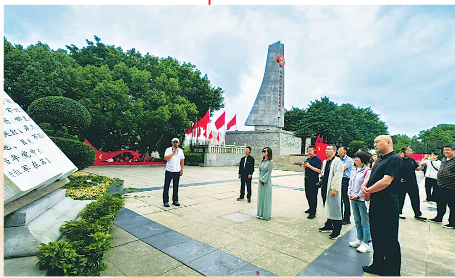
● 参观中央红军长征出发地

人有一代人的长征，一代人有一代人的担当。采风团成员纷纷表示，下一步，将切实转化采风成果，凝聚协作共识，深耕长征起点与终点红色IP，联合策划系列融媒体主题报道，串联南北红色故事、讲完整长征脉络；借鉴赣州宣传创新、产业发展、对外开放的先进经验，迭代升级延安红色宣传模式，提升红色文化传播力、影响力、引导力；立足基层一线、聚焦发展实践，以笔墨为炬、以镜头为媒，生动记录老区振兴发展的鲜活实践，书写新时代延安高质量发展、高水平振兴的崭新答卷。