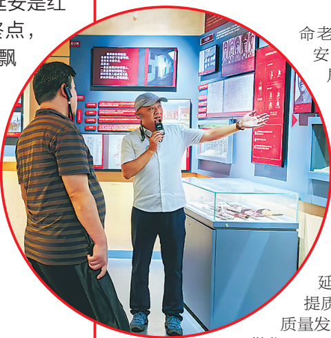
● 在叶坪革命旧址群参观学习

踏寻赣南红色热土，交流互鉴赋能宣传。近日，延安市广播电视家协会组织各会员单位及会员等相关人员，奔赴江西赣州开展“重走长征路·奋进新征程”主题采风实践活动。赣州是中央红军万里长征的初心起点，延安是红军长征胜利的落脚终点，一条横贯南北的“红飘带”，串联起两地一脉相承的革命根脉、同心同向的红色使命，为跨省红色文化交流、宣传互鉴架起互通桥梁。