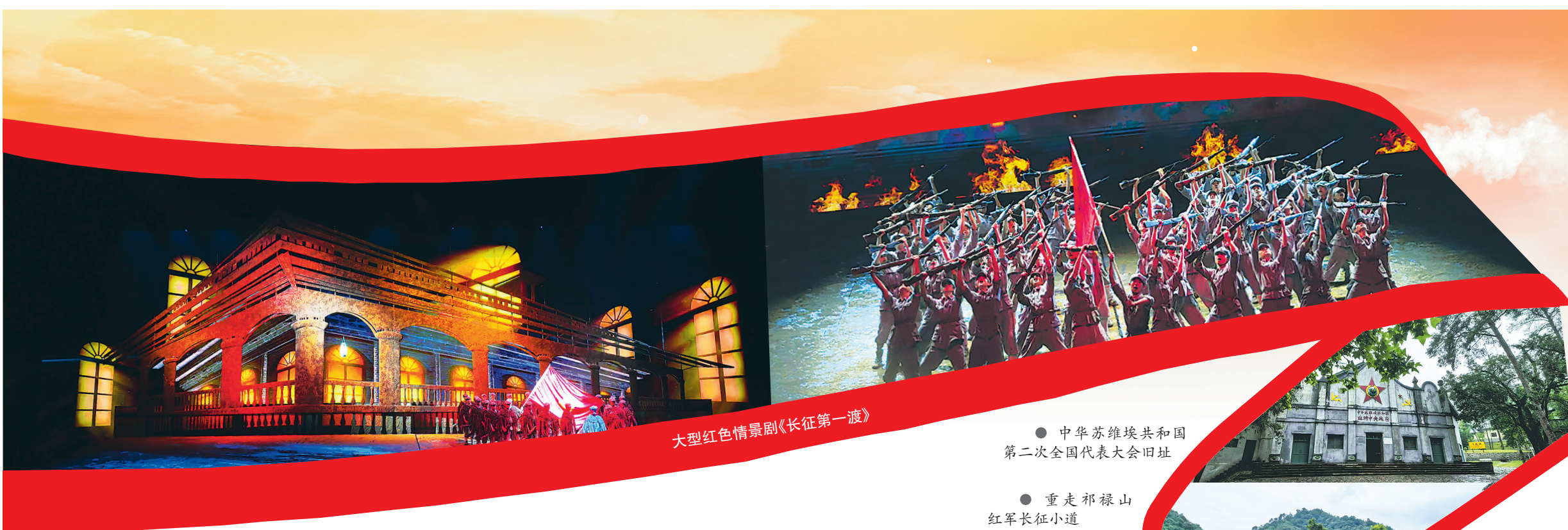
大型红色情景剧《长征第一渡》