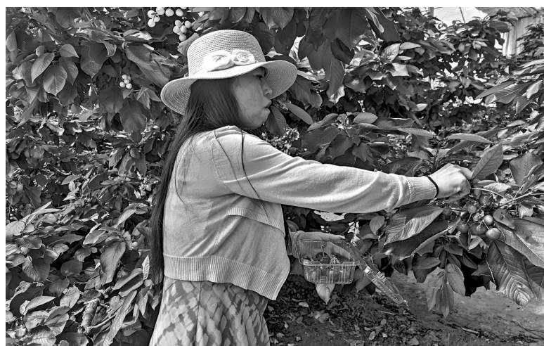
游客正在采摘车厘子