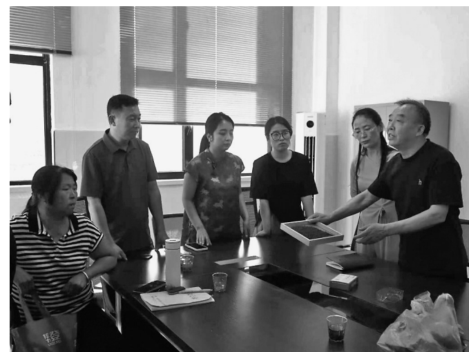
茶叶专家(右一)为参训人员讲解枣芽茶感官审评方法

本报讯(记者 李欢 通讯员 张萌 袁点)茶叶感官审评是把控产品质量、规范产业发展的关键环节。6月7日，延川县红枣技术推广和产业营销服务中心组织开展枣芽茶感官审评专题培训，各茶企负责人、技术骨干及相关从业人员参训，聚力提升枣芽茶审评专业水平。