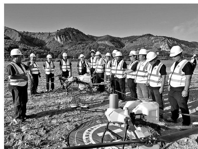
无人机专项技能培训现场

本报讯(记者 郝栋 邓志宏 通讯员 段梁梁)近日，陕西省农业广播电视学校子长市分校精准对接农业生产需求，在杨家园则镇杨二村高标准农田基地开展农业无人机专项技能培训，30余名农业从业者参训习艺，切实掌握智慧农耕新本领，为子长市现代农业高质量发展注入科技动能。