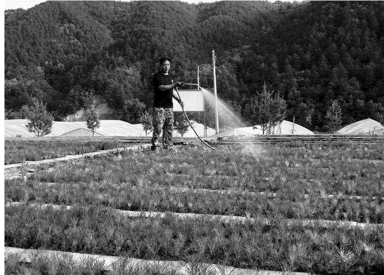
工作人员正在细心浇灌油松幼苗

初夏的龙乡大地，层林叠翠，绿意翻涌。走进延安市桥山国有林管理局各生态实验林场，漫山油松、侧柏亭亭玉立、苍翠欲滴，浓密的林海之下，淫羊藿、黄精等中药材破土生长、绿意盎然，错落间勾勒出一幅林茂药丰、生机勃勃的生态画卷。