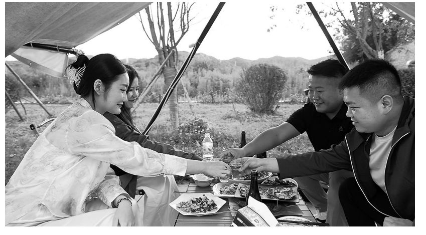
● 游客享受休闲时光

原生态的环境和贴心的服务，收获了众多游客的好评。周末期间，市民李娜带着家人专程前来体验乡村