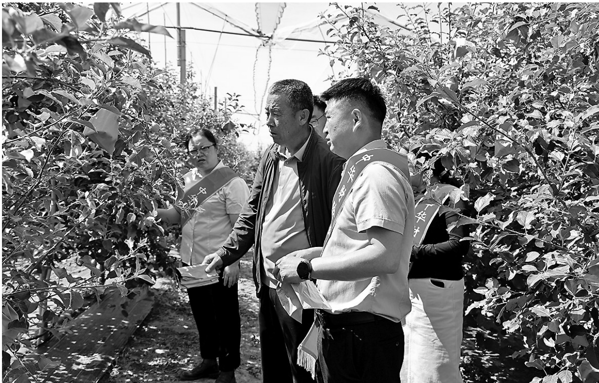
● 工作人员走进果园进行保险实地回访

近日，中华联合财产保险股份有限公司洛川支公司工作人员深入凤栖街道黑木村果园，开展政策性农业保险实地回访工作。工作人员细致查看果树长势、逐一核对农户投保信息，面对面倾听果农参保感受与实际需求，把精细化、贴心化的农险服务直达田间地头，切实打通惠农服务“最后一公里”。