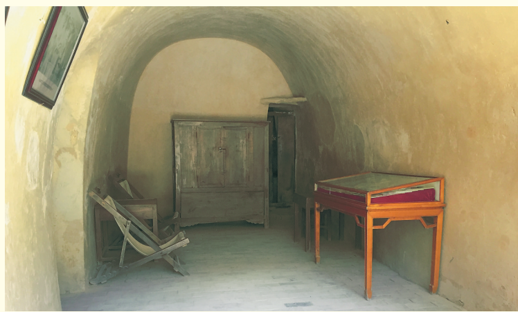
●杨家岭革命旧址毛泽东旧居内景