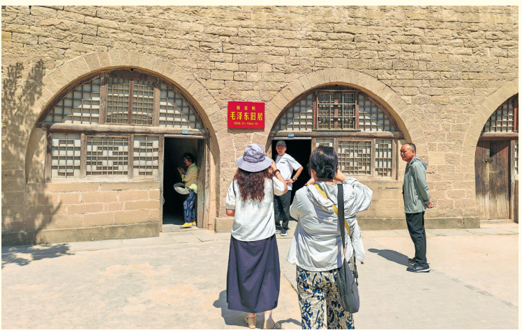
前拍照留念 ●游客在杨家岭革命旧址毛泽东旧居

从凤凰山麓到杨家岭,从枣园到王家坪,一孔孔土窑洞连成线,构筑起中国革命熠熠生辉的思想摇篮。极度的物质匮乏,反而淬炼出引领中国革命前行的先进思想与科学理论。这些窑洞静静诉说着峥嵘岁月,也无声昭示着每一位来访者:我们从哪里来,又该往哪里去。