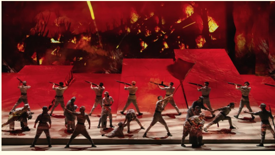
●《延安保育院》剧照 (资料图片)

“妈妈——”当《延安保育院》主人公远面朝滚滚延河发出撕心裂肺的呼喊,直入人心的台词搭配沉浸式舞台场景,瞬间戳中台下青年学子的心弦。