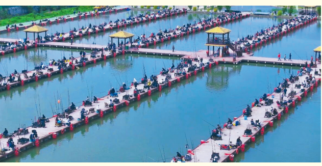
●黄龙垂钓大赛现场激战正酣

游局副局长张晓东说。从金延安的红色记忆到黄帝陵的千年文脉,延安正让历史从书本中“走”出来,变得可感、可触、可参与。