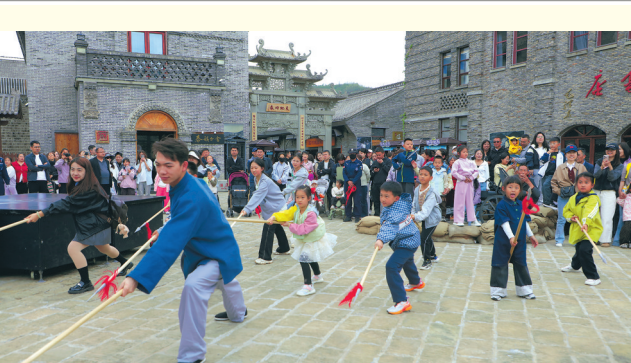
●游客在金延安景区参与红色剧演出

“花独放不是春,百花齐放春满园。延安的夏日文旅热潮是全市域、全业态的协同发力。宜川聚力做强壶口瀑布黄河文旅IP,涛声震天的瀑布之下,《黄河大合唱》实景演出让游客心潮澎湃;志丹、吴起深挖红色底蕴,打磨精品研学体系,一批又一批青少年走进革命旧址,聆听长征故事;富县、洛川盘活田园资源,苹果花海与乡土民俗相映成趣,做优乡村休闲业态。各县区坚持差异化布局、一体化联动,构建起“红色铸魂、生态赋能、文脉聚力、乡村添彩”的全域旅游高质量发展矩阵。