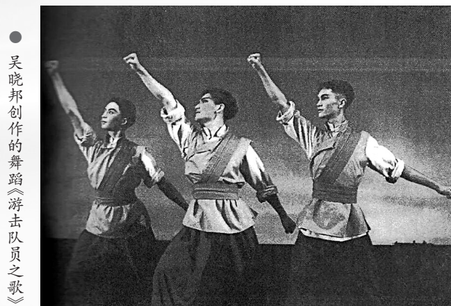
吴晓邦创作的舞蹈《游击队员之歌》