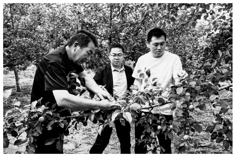
● 志丹县果业中心技术人员查看苹果长势

学成归来,刘光龙立刻把新技术用进果园,也实实在在地尝到了甜头。“以前50亩果园人工打药,从头到尾得忙活三天,费时费力还不均匀,现在用上弥雾机,三个小时就能全部完工,药效好、省人工。”新技术、新设备的落地应用,让果园管护效率大幅提升,果树长势、坐果率也实现质的飞跃。看着满园挂满枝头的幼果,刘光龙底气十足:“今年保守估计套袋二十万斤,丰收稳了!”