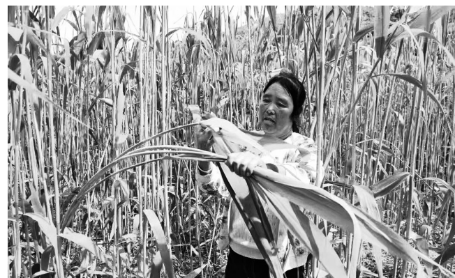
● 村民在采摘粽叶