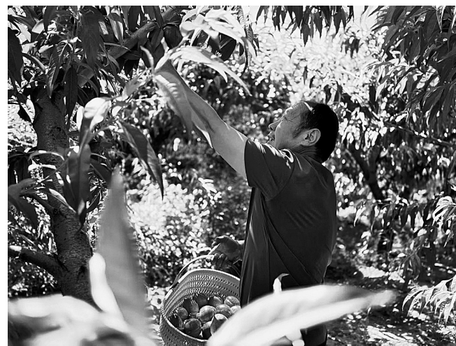
● 果农正在采摘油桃

本报讯(通讯员 李浩楠 刘建虎 记者 张译心)夏日时节,暖风和煦,万物繁茂。延川县各类时令瓜果次第成熟、新鲜上市,山野乡间处处涌动着丰收的气息。