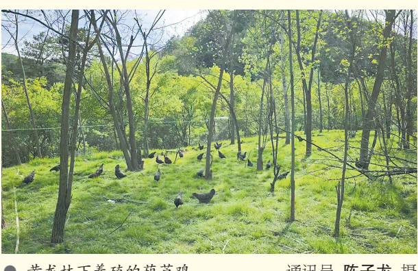
黄龙林下养殖的萌芦鸡

林下种植带来“立体收益”，生态养殖则在林海间酿出了“甜蜜事业”。在黄龙县，林下养殖已成规模。石堡镇油坊窑村的山