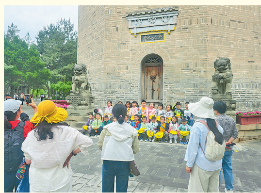
孩子们在宝塔山上拍照留念