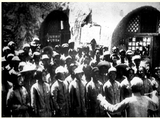
郑律成指挥音乐系同学练合唱(1939年) (资料照片)

“夕阳辉耀着山头的塔影，月色映照着河边的流萤……”舒缓深情的前奏缓缓响起，宝塔山巍然矗立，延河水静静流淌，八十多年前无数青年奔赴革命圣地的滚烫理想，随着悠扬旋律铺展眼前。诞生于鲁艺窑洞的《延安颂》，是烽火年代青年学子发自肺腑的礼赞，跨越山河岁月，依旧激荡着当代国人的红色初心。这首歌唱咏时而深情婉转，诉说着革命圣地的温情岁月；时而高亢激昂，唱响着军民同心、奋勇向前的壮志豪情。歌声之中，仿佛能看到延河流域，看到青年学子奔赴圣地的坚定身影，看到军民携手耕耘、并肩奋斗的动人画面，巍巍宝塔山在悠扬歌声里，更显庄严肃穆。